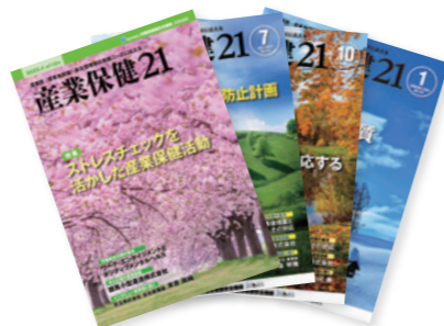
情報誌年4回発行 (ご希望者には無料送付)