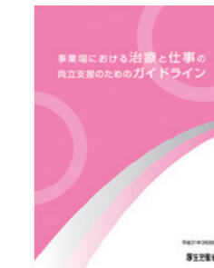
●事業場における治療と仕事の両立支援のためのガイドライン

お住いの近くで相談が 受けられるように、 県内の病院に相談窓口を 設置し、相談に応じます。 (*出張相談窓口はHPでご確認を)