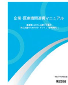
●企業-医療機関連携マニュアル