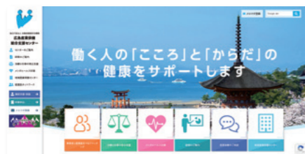
さんぽセンターのホームページ

産業保健に関する情報を、ホームページ、メールマガジン、情報誌を通じてお知らせしています。