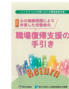
●職場復帰支援の手引き